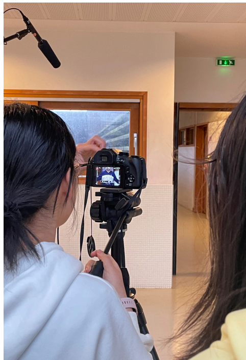
EXERCICE DE TOURNAGE EN 2025