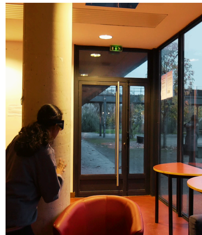
EXERCICE DE TOURNAGE EN 2025 LE TRAVELLING