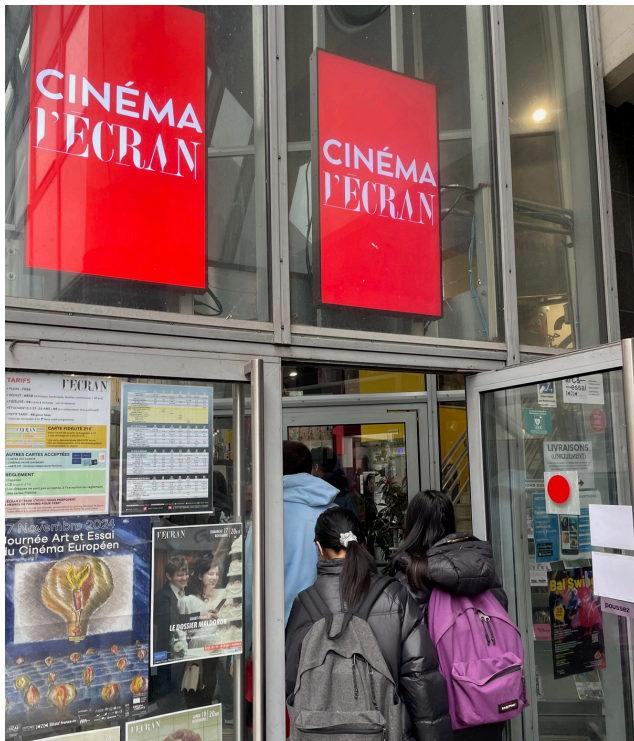
CINÉMA PARTENAIRE DE L'OPTION CAV