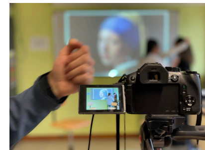
EXERCICE DE TOURNAGE EN 2025