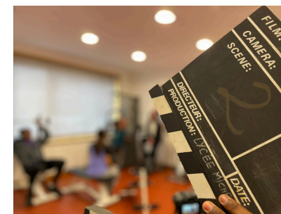
TOURNAGE EN 2026