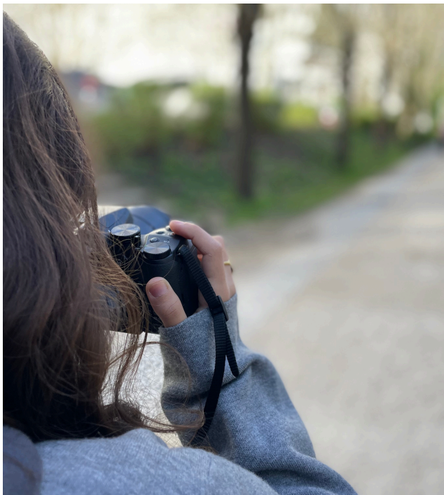
TOURNAGE EN 2026