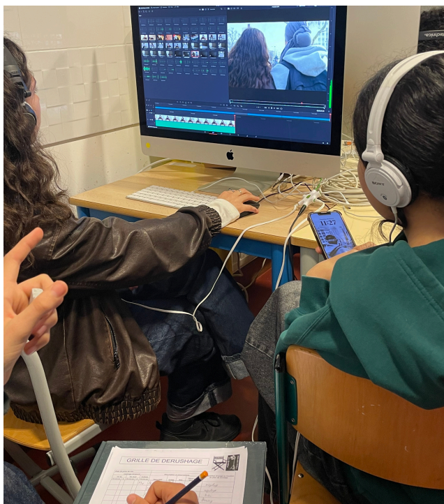
MONTAGE DU FILM DE BAC EN 2026